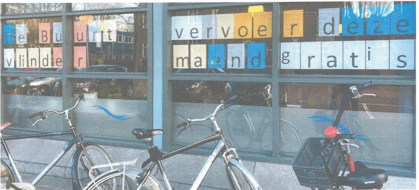
De Strooming: Home of the Buurtvlinder